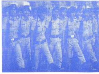
पोलीस भरतीपुर्व प्रशिक्षण