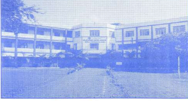
महाविद्यालयाची सुसज्ज इमारत